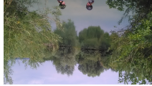
Weiher im Donauried